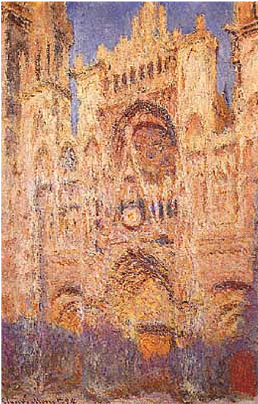
Oscar-Claude Monet, Cattedrale di Rouen