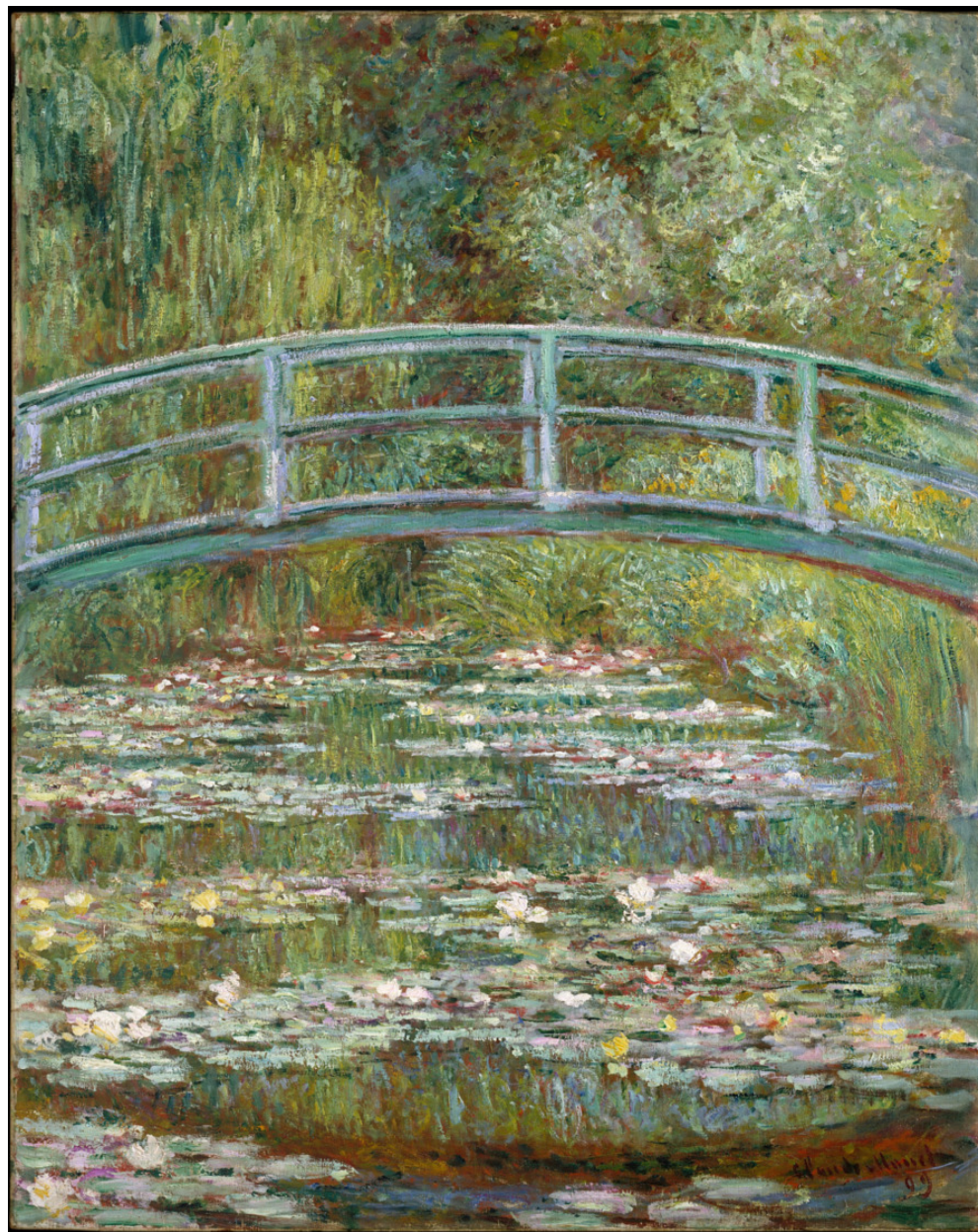
Oscar-Claude Monet, Lo stagno delle ninfee