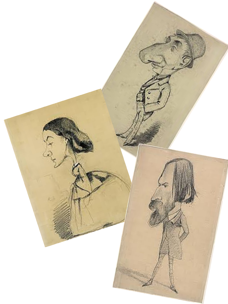
Oscar-Claude Monet, alcune caricature