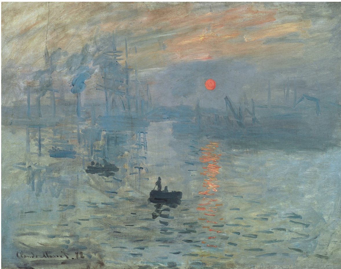
Oscar-Claude Monet, Impression. Soleil levant

"Dato che ovviamente non poteva passare per una vista di Le Havre, risposi: scrivete IMPRESSIONE ."